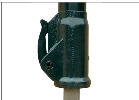
Einfacher und schneller Wechsel des Meissels.