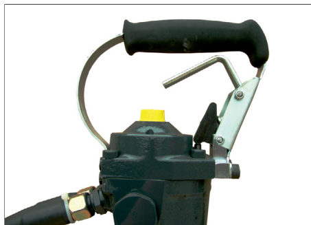
Vibrationsdämpfender „D-Griff“ für den horizontalen Einsatz (BHB 12).