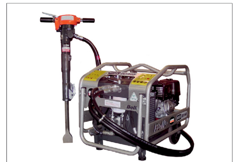
Ausgestattet mit 1/2" Schnellkupplungen passend für BELLE Hydraulikaggregate.