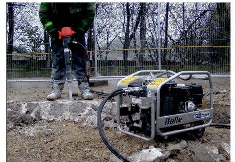
Ausgestattet mit 1/2" Schnellkupplungen passend für BELLE Hydraulikaggregate.