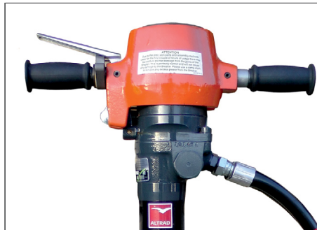
Stark vibrationsdämpfende Griffe, komfortabel bei alle Anwendungen (BHB 25X), ohne Reduzierung der Schlagkraft.