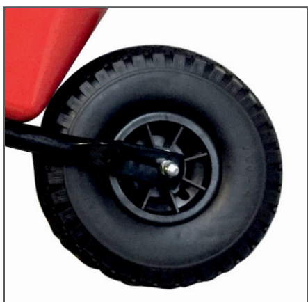
PP-Kunststoff Felge mit Gleitlager und pannensicherem PU-Rad.