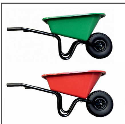
Leichte Kunststoff Mulde und robuster 2-teiliger Rundrahmen.