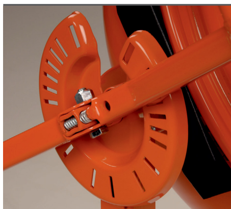
Großes Handrad mit Multirastscheibe.