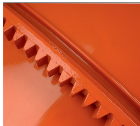
Pulverbeschichtet für eine hohe Lebenserwartung & abriebfester Zahnkranz und Antriebsritzel aus Grauguss.