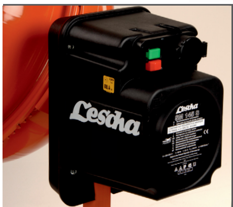
Strahlwassergeschütztes Motorhaus aus schlagfestem Kunststoff.