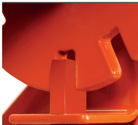
Großes Handrad mit Rastscheibe und Fußbedienung.