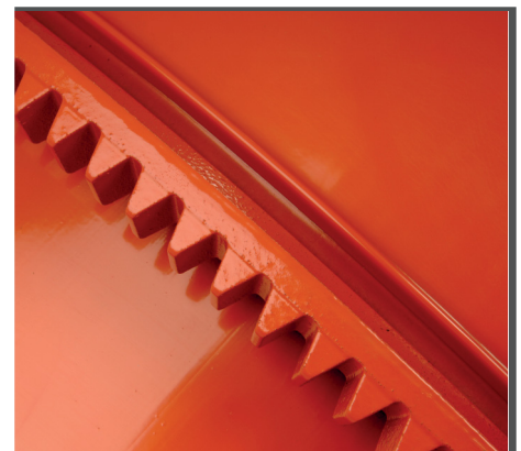
Pulverbeschichtet für eine hohe Lebenserwartung & abriebfester Zahnkranz und Antriebsritzel aus Grauguss.