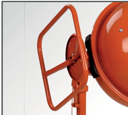
Ergonomisches & leichtgängiges Handrad mit Scheibenbremse & Fußbedienung für das stufenlose Verstellen der Mischtrommel.