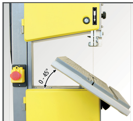
Stufenlos verstellbarer Aluminium Sägertisch von 0 bis 45°.