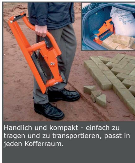
Handlich und kompakt - einfach zu tragen und zu transportieren, passt in jeden Kofferraum.