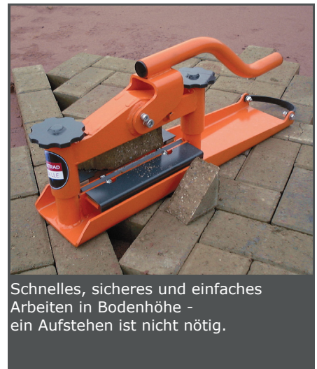
Schnelles, sicheres und einfaches Arbeiten in Bodenhöhe - ein Aufstehen ist nicht nötig.