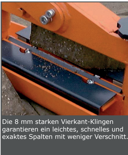
Die 8 mm starken Vierkant-Klingen garantieren ein leichtes, schnelles und exaktes Spalten mit weniger Verschnitt.