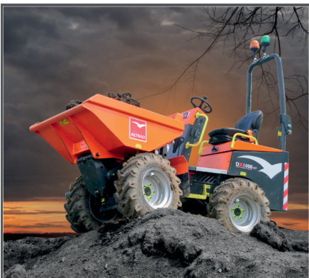
Der DX 1000 HT ist die neue Nr. 1 in der Klasse der besten 1-Tonnen Hochkippdumper. Ein ungeschliffener Diamant!