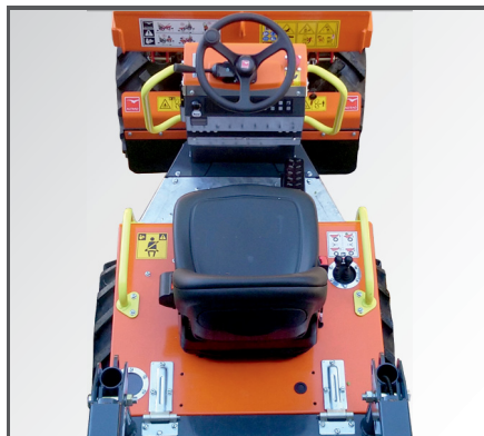
Ergonomischer Arbeitsplatz mit leicht zu erreichenden Bedienelementen, bequemem, verstellbarem Markenkomfortsitz und guter Rundumsicht.