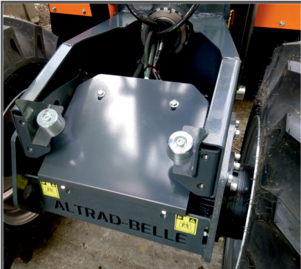
Robuste Stahlschutzabdeckung mit vorderem Eingreifschutz verhindert Schäden an dem Hydraulikkreislauf.