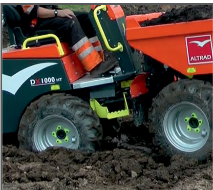
Hochwertige, geländegängige Räder mit Mehrzweckreifen, Ventilschutzabdeckungen und optischen Radmutter-Kontrollanzeigern.