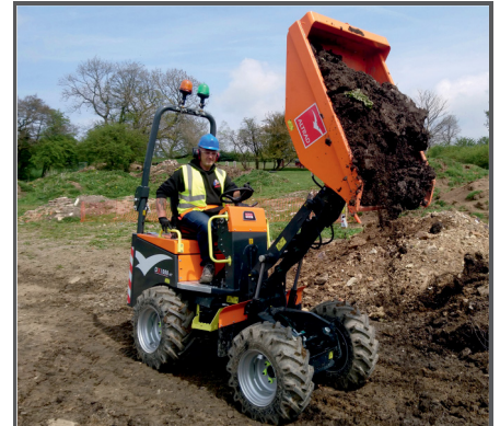
Hydraulischer, hoher Kipp-Mechanismus für Nutzlasten bis 1 Tonne.