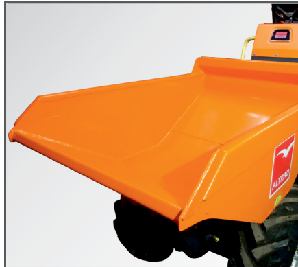
Große, robuste und leicht zu reinigende Mulde mit runden Ecken und einer maximal möglichen Füllung von 500 Liter (gehäufte Füllung) oder 1000 kg.