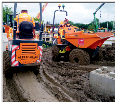
Der hydraulische 4-Rad (Allrad) Antrieb von Altrad sorgt für eine bessere Traktion im rauen Gelände sowie bei übermäßigem Schlamm.