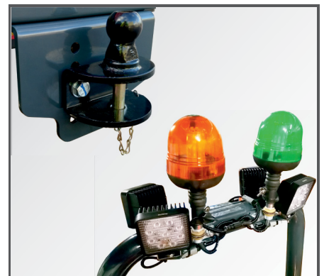
Weiteres, nützliches Zubehör auf Anfrage erhältlich.