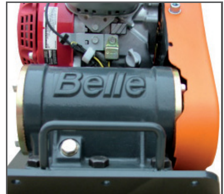
Hochfrequenz-Vibrationseinheit mit 11 kN bei 101 Hz sowie praktischem Tragegriff an der Grundplatte.