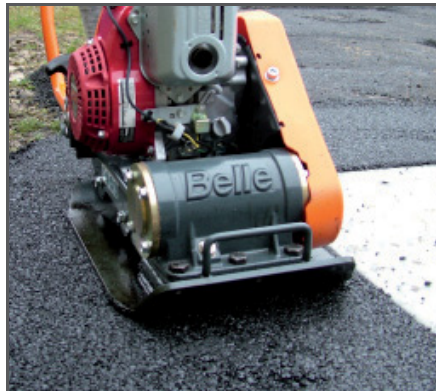
Kompakt & wendig, ideal für Ausbesserungsarbeiten.