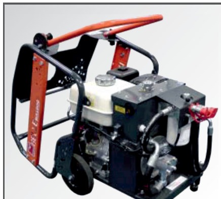
Der aufklappbare Schutzrahmen ermöglicht eine einfache Wartung.