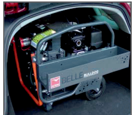
Das kompakte Design ermöglicht den Transport in einem Kombi Kofferraum.