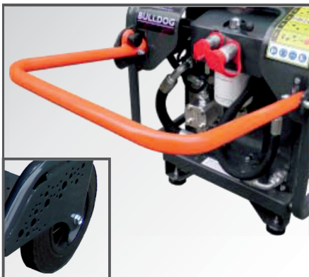
Der klappbarer Bügelgriff und die Räder gewährleisten einen einfachen Standortwechsel.