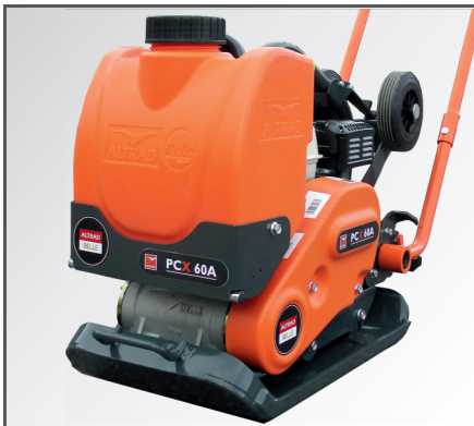
Serienmäßig mit Wasser-Set (12 Liter großer Wassertank & Wassersprühanlage).