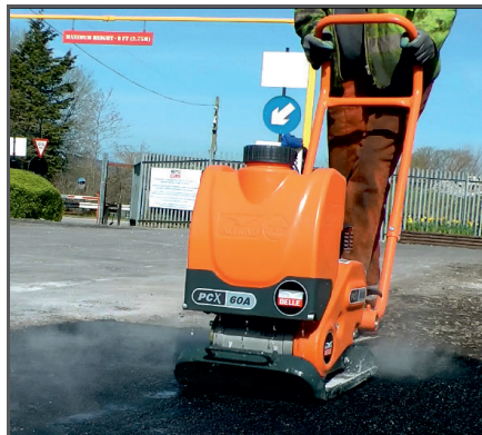
Mittelschwere, vorlaufende Mehrzweck Rüttelplatte mit Hochfrequenz-Vibrationseinheit (11 kN bei 101 Hz) sowie ultimativer Kombination aus Gewicht, Leistung und Vielseitigkeit.