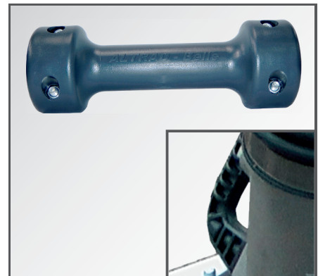
Inklusive komfortabler Transportrolle sowie Transportgriff, die einen vereinfachten Transport ermöglichen.