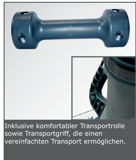
Inklusive komfortabler Transportrolle sowie Transportgriff, die einen vereinfachten Transport ermöglichen.