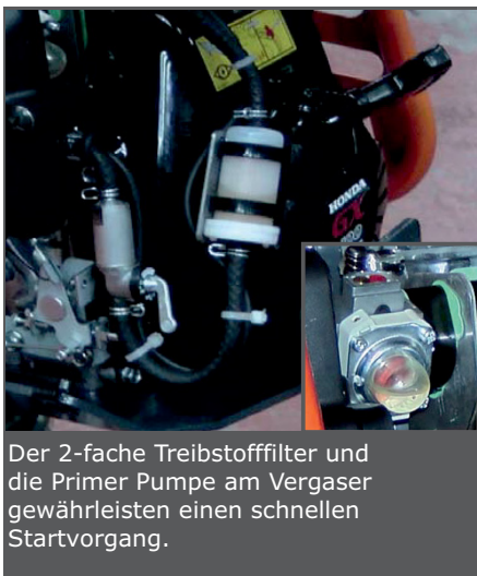
Der 2-fache Treibstofffilter und die Primer Pumpe am Vergaser gewährleisten einen schnellen Startvorgang.