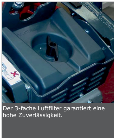
Der 3-fache Luftfilter garantiert eine hohe Zuverlässigkeit.