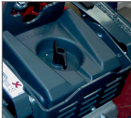
Der 3-fache Luftfilter garantiert eine hohe Zuverlässigkeit.