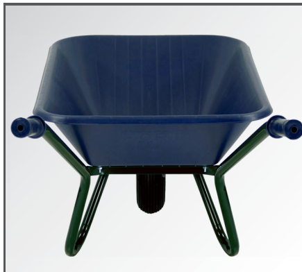
Schlagfeste und leichte aber trotzdem stabile Polypropylen (PP) Kunststoff Mulde.