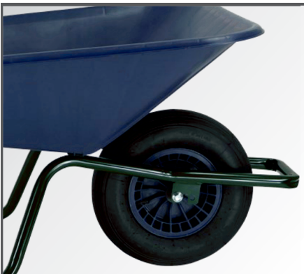
PP-Kunststoff Felge mit Nadellager und Luftbereifung mit 2-lagigem Mantel.