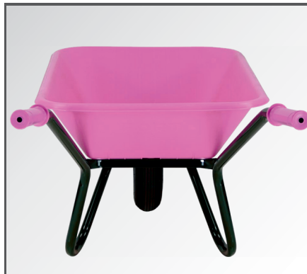
Schlagfeste und leichte aber trotzdem stabile Polypropylen (PP) Kunststoff Mulde.