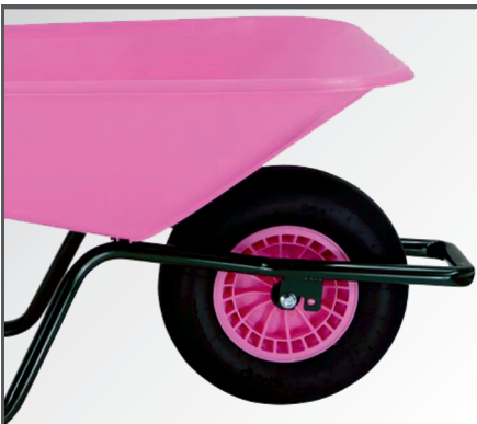
PP-Kunststoff Felge mit Nadellager und Luftbereifung mit 2-lagigem Mantel.