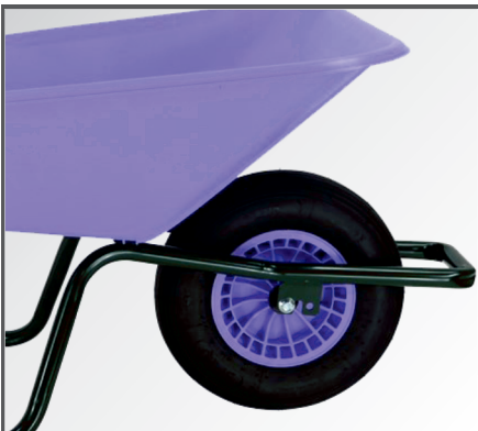
PP-Kunststoff Felge mit Nadellager und Luftbereifung mit 2-lagigem Mantel.