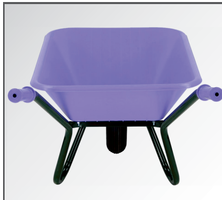
Schlagfeste und leichte aber trotzdem stabile Polypropylen (PP) Kunststoff Mulde.