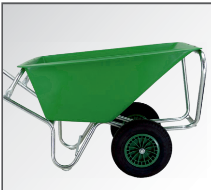
2 Räder bestehend aus PP-Kunststoff Felgen, Nadellager & Luftbereifung mit 4-lagigem Mantel. Rahmen mit Kipp-, Muldenstützbügel und Verschleißkufen.