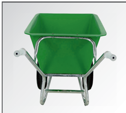
Schlagfeste und leichte aber dennoch stabile HDPE Kunststoff Mulde sowie rutschfeste PP-Kunststoff Handgriffe und Rahmen mit Verstärkungsstreben.