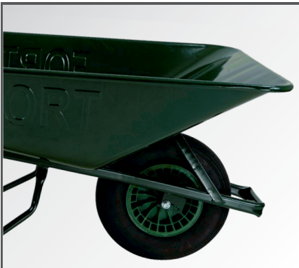
Kipp- und Muldenstützbügel sowie PP Kunststoff Felge mit Nadellager und Luftbereifung mit 2-lagigem Mantel.