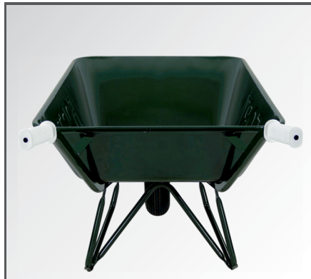
Sehr große, pulverbeschichtete 130 Liter Stahlblech Mulde sowie rutschfeste PP Kunststoff Handgriffe.