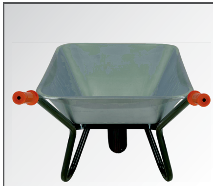
Stabile, verzinkte Stahlblech Mulde sowie Rahmen mit rutschfesten Handgriffen aus PP Kunststoff.