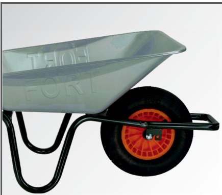
PP-Kunststoff Felge mit Nadellager und Luftbereifung mit 2-lagigem Mantel sowie Kippbügel.