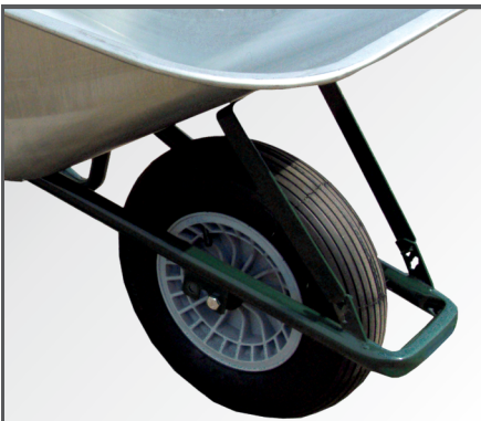
Kipp- und Muldenstützbügel sowie PP Kunststoff Felge mit Nadellager und Luftbereifung mit 2-lagigem Mantel.