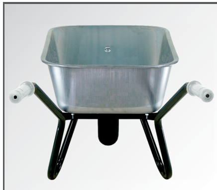
Große, verzinkte 100 Liter Stahlblech Mulde sowie rutschfeste PP Kunststoff Handgriffe.