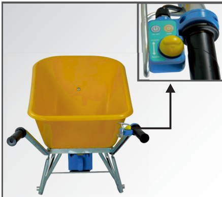
Joysticksteuerung mit Bergabfahrhilfe (HDC) und Handschutz direkt am Handgriff. Einfach mit dem Daumen zu bedienen.