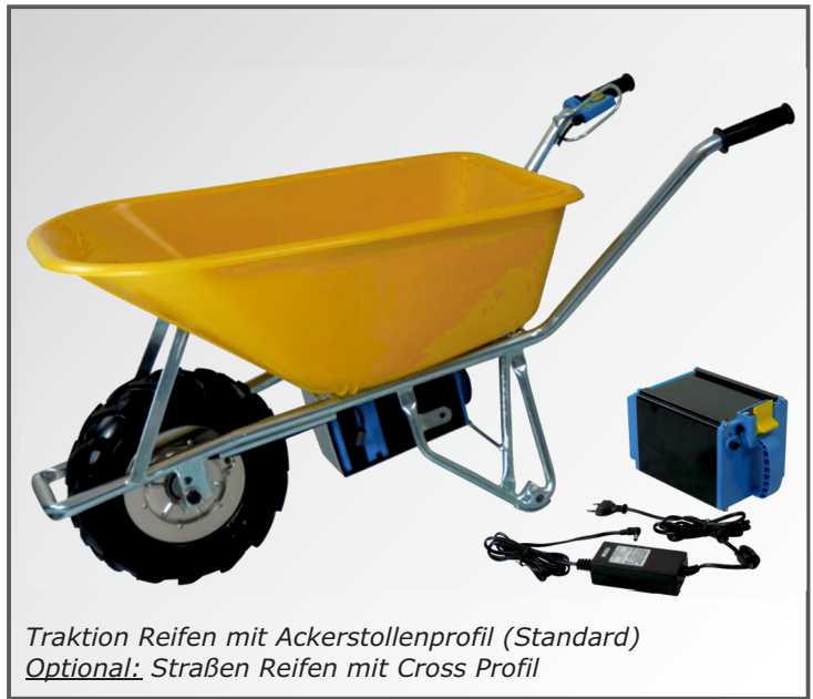
Traktion Reifen mit Ackerstollenprofil (Standard) Optional: Straßen Reifen mit Cross Profil