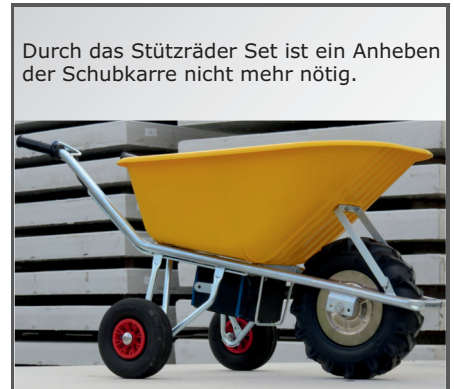
Durch das Stützräder Set ist ein Anheben der Schubkarre nicht mehr nötig.