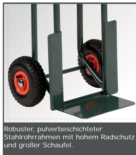
Robuster, pulverbeschichteter Stahlrohrrahmen mit hohem Radschutz und großer Schaufel.