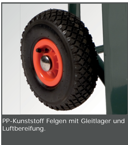
PP-Kunststoff Felgen mit Gleitlager und Luftbereifung.