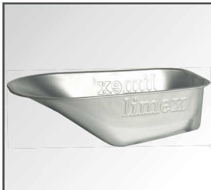
Große, verzinkte 100 Liter Stahlblech Mulde mit gerader Front.