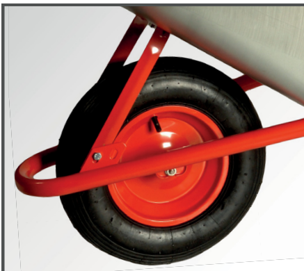
Kipp- und Muldenstützbügel sowie pulverbeschichtete Stahlfelge mit Gleitlager und Luftbereifung.