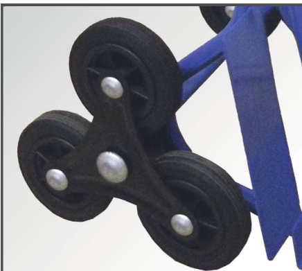
Drehbare, pannensichere Vollgummi-Sternenräder mit PP-Kunststoff Felgen sowie Räderschutz.