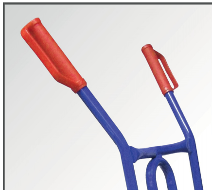
Rutschfeste Handgriffe mit Sicherheitsbügel.