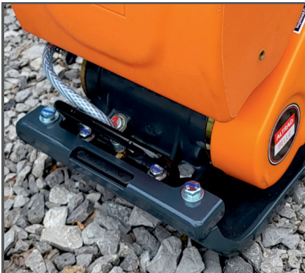
Wasser-Set (Wassertank & Wassersprühanlage) als Zubehör erhältlich: Art.-Nr. BEOPP/51S/DIO (PCLX 32) Art.-Nr. BEOPP/54S/DIO (PCLX 40)