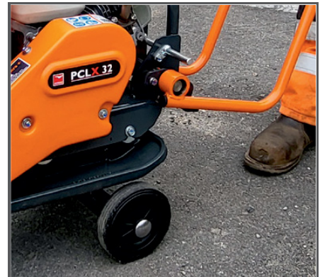
Ein klappbares Fahrwerk für den einfachen Transport ist ebenfalls als Zubehör erhältlich: Art.Nr. BEOPP/60/DIO