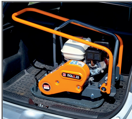
Der einklappbare Handgriff ermöglicht einen einfachen Transport sowie eine platzsparende Lagerung.