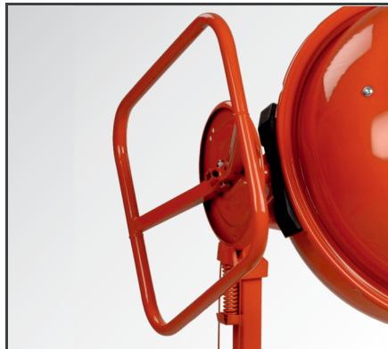
Ergonomisches & leichtgängiges Handrad mit Scheibenbremse & Fußbedienug für das stufenlose Verstellen der Mischtrommel.