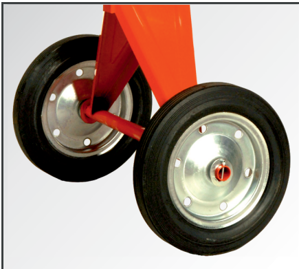
Große Räder (Ø 400 mm), mit Metall-felgen und pannensicherer Vollgummi-bereifung, für einen einfachen Transport.