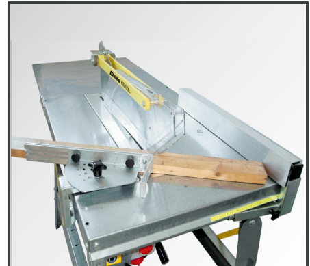
Präzises Arbeiten dank Quer- & Gehrungsanschlag mit Keilschneidlehre sowie Längsanschlag mit verstellbarer Aluminium-Anschlagleiste.