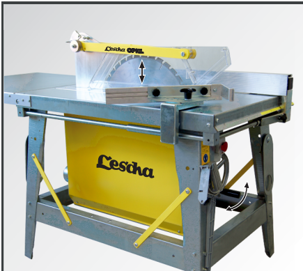
Robustes, vollverzinktes Metallgestell mit Verstärkungsstreben, Kranösen und leichtgängigem Handrad für die präzise Schnitthöhenverstellung.