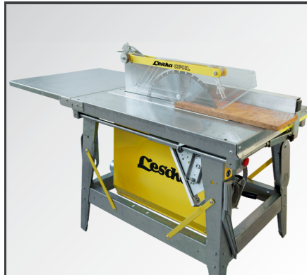
Für größere Werkstücke ist der gleitlagergeführte Quer- & Längsanschlag, wie auch die Tischverlängerung, auf- und abklappbar.