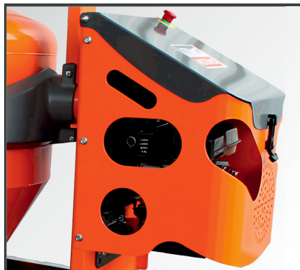
Leistungsstarke Benzinmotoren mit Poly-V Riemenantrieb gewährleisten ein optimales Durchmischen.