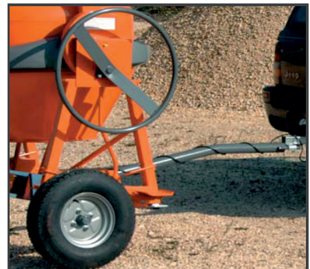
Großes Handrad mit Schwenkgetriebe und Fußpedal sowie Fahrwerk mit 13 Zoll Stahlfelgen und 135er Straßenreifen.