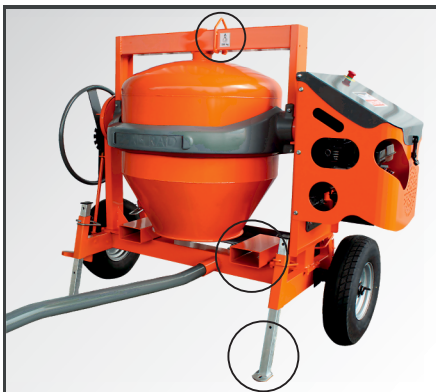
Kranöse und Gabelaufnahmen für ein einfaches Umsetzen. Verzinkte, teleskopierbare Standbeine für einen sicheren Stand.