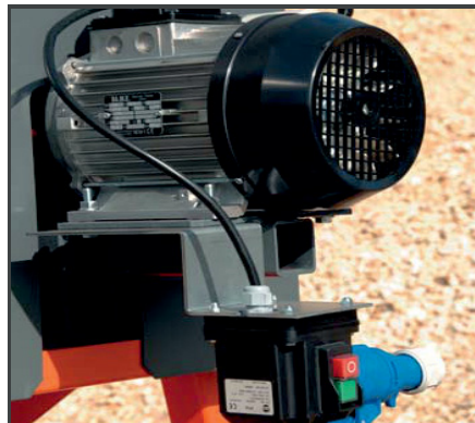
Kraftvolle Elektromotoren gewährleisten ein optimales Durchmischen.