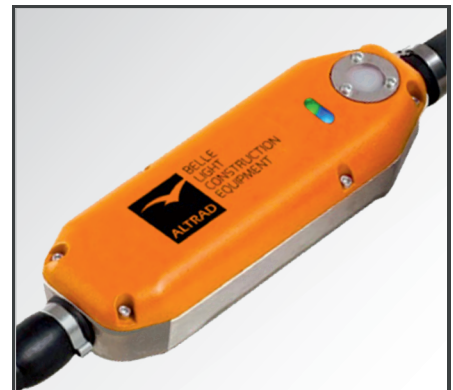
Robustes, druckgegossenes Aluminiumgehäuse mit moderner LED Statusanzeige.