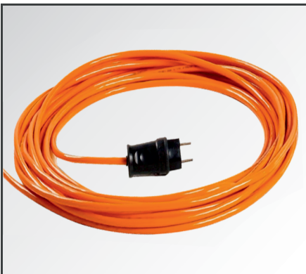
15 Meter langes Anschlusskabel, perfekt für große Baustellen.