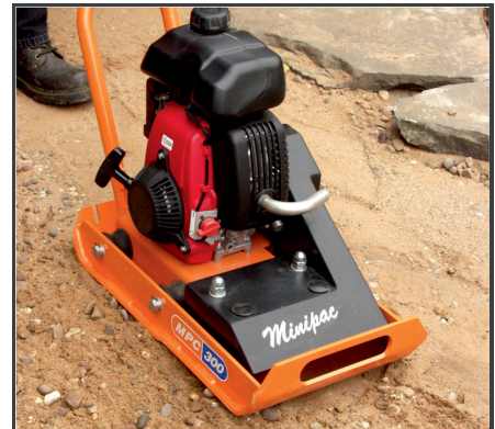
Das kompakte Design gewährleistet das Arbeiten bei beengten Platzverhältnissen.