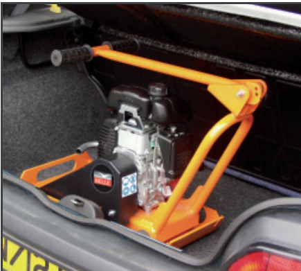
Das kompakte & handliche Design sowie der einklappbare Handgriff ermöglichen einen einfachen Transport in jedem Kofferraum.