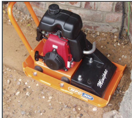
Hochwertige „Dual Force“ Grundplatte für eine effektive Verdichtung.