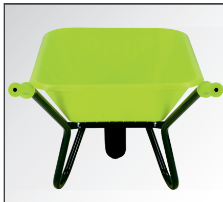
Schlagfeste und leichte aber trotzdem stabile Polypropylen (PP) Kunststoff Mulde.