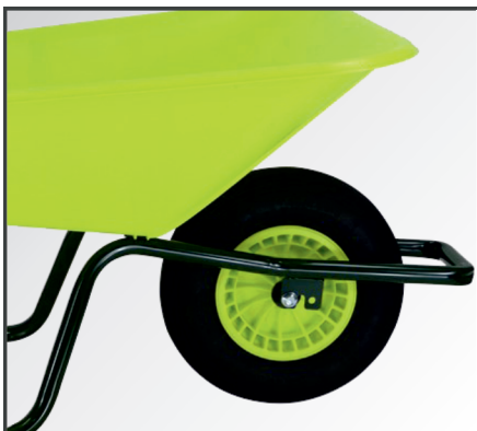
PP-Kunststoff Felge mit Nadellager und Luftbereifung mit 2-lagigem Mantel.