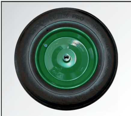
Pannensicheres Starco Flex Pro PU Rad mit robuster Stahlfelge und Gleitlager.