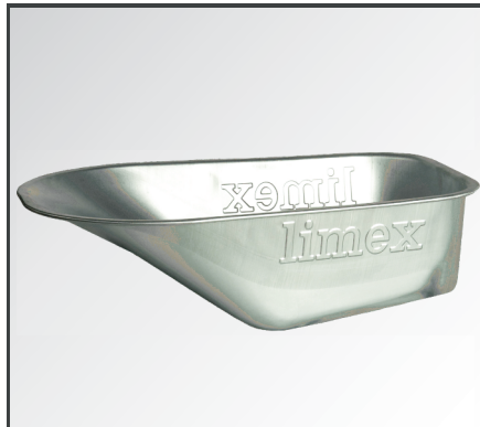
Große, verzinkte 100 Liter Stahlblech Mulde mit gerader Front.