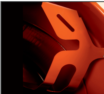
Speziell geformte Mischrechen für gute Mischergebnisse.