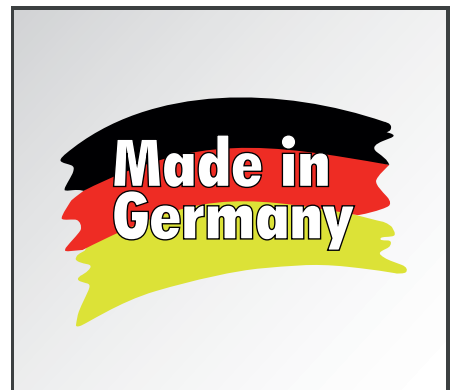
Qualität - Made in Germany.