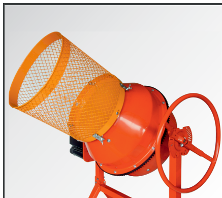
Einfach auf die gebördelte Trommelöffnung des Betonmischers montieren.