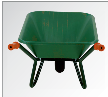
Schlagfeste und leichte aber trotzdem stabile Polypropylen (PP) Kunststoff Mulde.