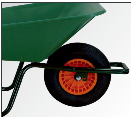
PP-Kunststoff Felge mit Nadellager und Luftbereifung mit 2-lagigem Mantel.