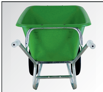
Schlagfeste, leichte aber dennoch stabile HDPE Kunststoff Mulde mit Inhaltsangabe. Komfortable und rutschfeste PP-Kunststoff Handgriffe.