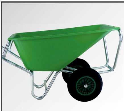
2 Räder bestehend aus PP-Kunststoff Felgen, Nadellager & Luftbereifung mit 4-lagigem Mantel. Rahmen mit Kipp-, Muldenstützbügel und Verschleißkufen.