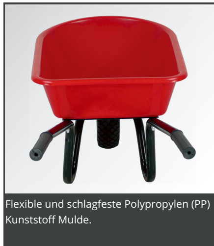
Flexible und schlagfeste Polypropylen (PP) Kunststoff Mulde.