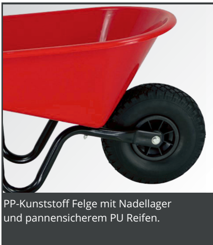
PP-Kunststoff Felge mit Nadellager und pannensicherem PU Reifen.