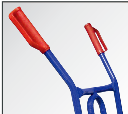
Rutschfeste Handgriffe mit Sicherheitsbügel.