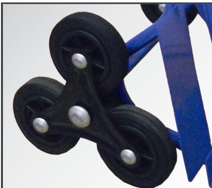
Drehbare, pannensichere Vollgummi-Sternenräder mit PP-Kunststoff Felgen sowie Räderschutz.