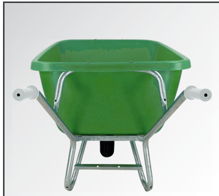
Schlagfeste und leichte aber dennoch stabile MDPE Kunststoff Mulde sowie rutschfeste PP-Kunststoff Handgriffe und Rahmen mit Verstärkungsstreben.