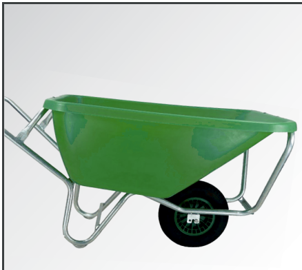
PP-Kunststoff Felge, Nadellager und Luftbereifung mit 4-lagigem Mantel. Rahmen mit Kipp-, Muldenstützbügel und Verschleißkufen.