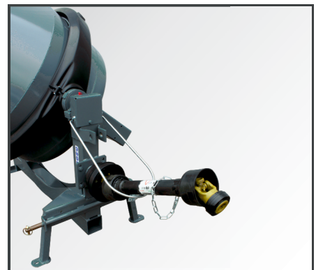
Zapfwellen Anschluss und praktischer Zapfwellen Halter. Zapfwelle (510 mm lang) als Zubehör erhältlich Art.Nr.: LZ030