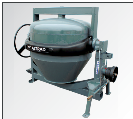
Gebördelte, stoßfeste Trommelöffnung und umlaufender Zahnkranzschutz für mehr Sicherheit.